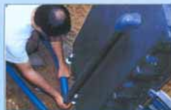
Si raccordano i tubi