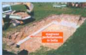
Si effettua lo scavo