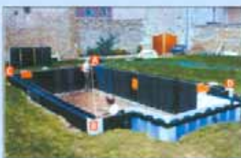
Si controllano i livelli