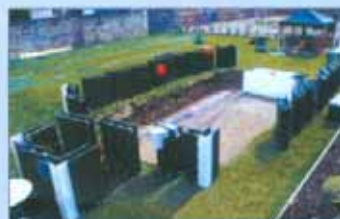
Si posizionano i pezzi