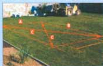
Si disegna il terreno