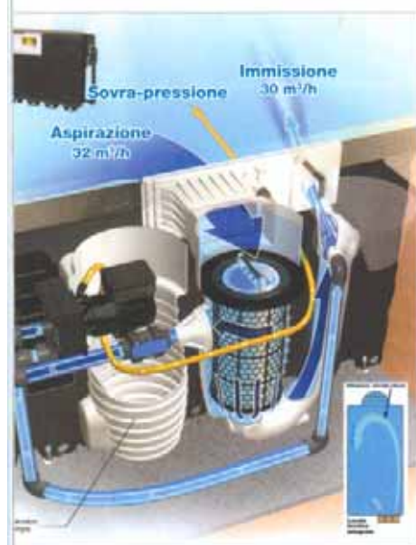
Il sistema di filtrazione è concentrata in un unico modulo

L'esclusivo sistema Magiline con pannelli alveolari in polipropilene permette di costruire una piscina in meno di una settimana. La piscina viene consegnata in kit, completa di ogni accessorio e può essere assemblata velocemente e senza bisogno di contrafforti.