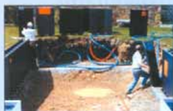
Si assembla il tutto

I casseri a perdere Magiline offrono una resistenza ed affidabilità strutturale identica a quella del cemento armato con un risparmio di cemento nell'ordine del 20-30%. Le foto, tratte da un filmato, dimostrano come una piscina Magiline, riempita d'acqua, sia sollevabile interamente da una gru. L'esperimento è stato svolto in Francia alla presenza di un notaio.