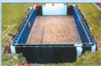
Si chiude la costruzione