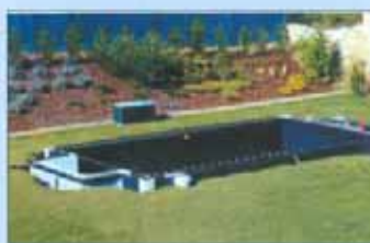
Si getta il cemento