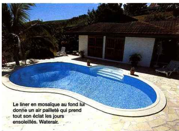
Le liner en mosaïque au fond lui donne un air pailleté qui prend tout son éclat les jours ensoleillés. Waterair.

tombent pas dans le bassin, des barrières escamotables sont disponibles pour toutes les tailles. Pas d'inquiétude, elles ne vont pas pour autant ruiner l'harmonie rêvée des fournisseurs prévoient la nature du sol dans lequel la barrière s'intègre et