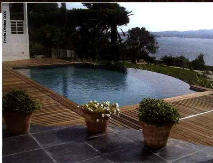
▲ ► Ces barrières escamotables réalisées sur mesure permettent d'assurer la sécurité de la piscine quand cela est nécessaire. Ensuite, elles se fondent dans le sol en bois en toute discrétion. Diodon.

portillon Pour que le bassin corresponde vraiment à la forme souhaitée, la construction traditionnelle en béton s'avère une option judicieuse puisqu'elle s'adapte à tout terrain et peut prendre n'im-