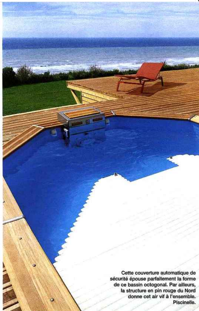
Cette couverture automatique de sécurité épouse parfaitement la forme de ce bassin octogonal. Par ailleurs, la structure en pin rouge du Nord donne cet air vif à l'ensemble. Piscinelle.