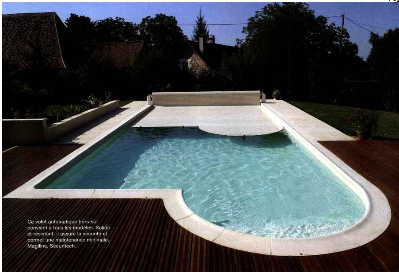
Ce volet automatique hors-sol convient à tous les modèles. Solide et résistant, il assure la sécurité et permet une maintenance minimale. Magiline, Sécuritétech.