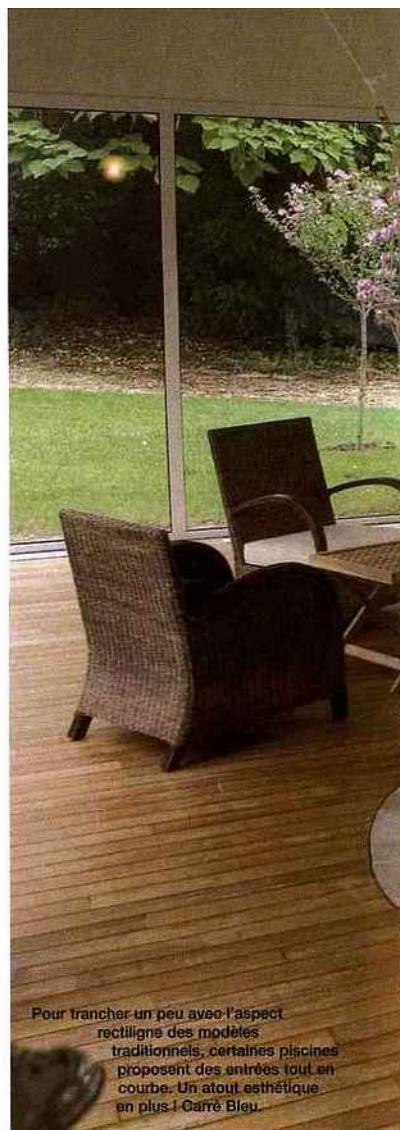
Pour trancher un peu avec l'aspect rectiligne des modèles traditionnels, certaines piscines proposent des entrées tout en courbe. Un atout esthétique en plus ! Carré Bleu.