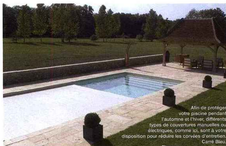
Afin de protéger votre piscine pendant l'automne et l'hiver, différents types de couvertures manuelles ou électriques, comme ici, sont à votre disposition pour réduire les corvées d'entretien. Carré Bleu.